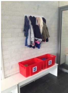
verzamelplaats 1 – kleuterschool